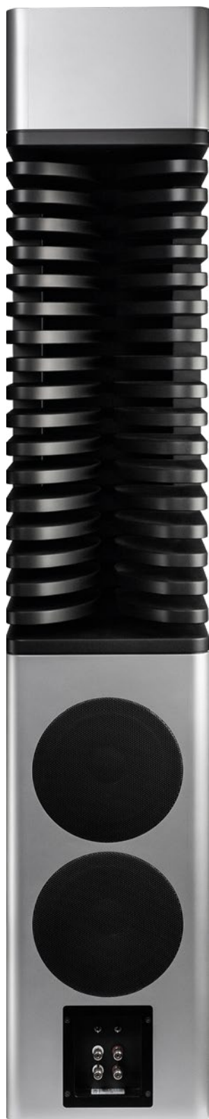
Rückseitig wartet der MLS2 mit Bi-Wiring, Passivradiatoren und Klanganpassung auf

durchaus streitbar, aber definitiv ein Leckerbissen. Unsere ganz persönliche Lovestory ging so: Seit mehreren Jahre schon reisen wir regelmäßig nach Asien und beobachten den dortigen HiFi- und High-End-Markt. Die Asiaten