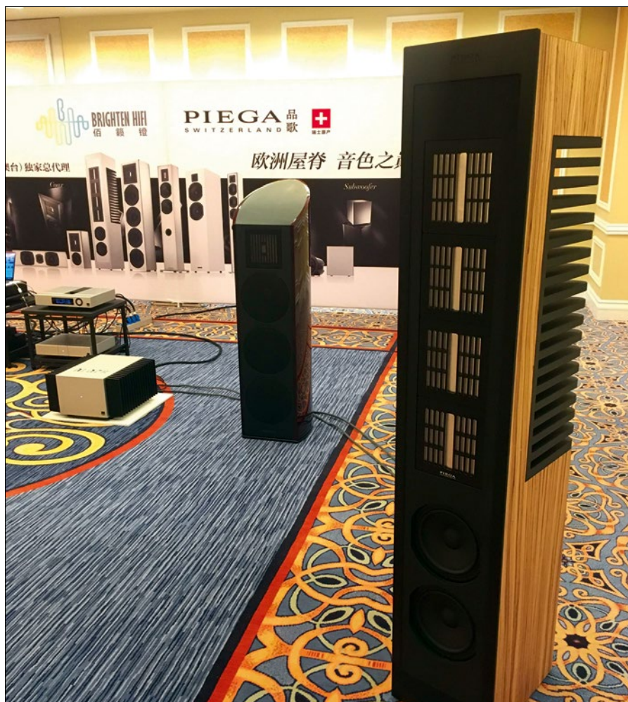
Auf der MIAV 2018 in Macao hat es Klick gemacht. In Kombination mit den Mono Block-Verstärkern von Blockaudio s.r.o. spielten die MLS2 perfekt auf

klings perfekt.“ Wir hatten an dem Tag eigentlich noch weitere Termine, die aber dann erst mal warten mussten. Verstört und betört ließen wir den Blick durch den Raum schweifen. Da standen neben den Piega MLS2 auch noch Lautsprecher aus der Classic Line des Schweizer Unternehmens im Raum. Aber warum waren wir auf einmal so angetan von den MLS2, die uns doch bis dato zwar bekannt waren, aber auf Messen und Veranstaltungen nie wirklich von den Socken gehauen haben? Der Schlüssel liegt im Verstärker. In Macao spielte man mit einem uns bis dahin unbekanntem Mono-Endstufen-Modell des tschechischen Herstellers Blockaudio s.r.o mit dem überraschenden, wie naheliegenden Namen Mono Block. Ein 90 Kilo-Hammer in doppelter Ausführung. 500 Watt bringt einer auf die Beine, davon alleine 200 Watt in reiner Class