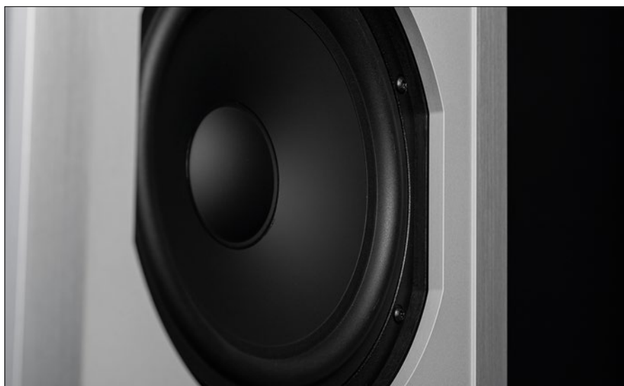
Die 220 Millimeter Basstreiber bringen 65 Liter Volumen zum Klingen, das macht den Lautsprecher besonders für große Räume interessant. 30 Quadratmeter oder mehr sollten es sein

anregt, ohne ihn jedoch komplett zu isolieren, was ebenfalls unnatürlich wäre. Der Raum wird durch den rückseitigen Schallaustritt des Dipol-Lautsprechers über eine akustische Linse inkludiert. Dieser rückseitige Schall ist für die Natürlichkeit von essentieller Bedeutung, aber überlagert sich eben nicht so sehr mit dem Direktsignal, wie die sogenannten Erstreflexionen. Zudem wird über die akustische Linse der rückseitige Schall diffus gestreut, was den Direkttheits-Effekt der Linien-schallquelle noch verstärkt. Die Linienquelle, also Line Source, wird durch eine Armada an Bändchenhoctönern realisiert. Die mittleren Bändchen dienen dabei als Hochtöner und konzentrieren sich auf die Bereiche ab 3 kHz. Die Bändchen links und rechts davon übernehmen den Mittenpart zwischen 500 Hz und 3 kHz. Wer Bändchen kennt, weiß, dass es kaum etwas edleres für fragile Transienten gibt. Zudem sind diese Treiber hocheffektiv und so verwundert es kaum, dass der MLS2 mit einem Wirkungsgrad von 92 dB auftrumpfen kann. Piega geht sogar so weit zu behaupten, dass man die mannshohen Kolosse mit einem 20 Watt Verstärker betreiben kann. Ganz schön mutig. Wir meinen, bitte liebe deutlich mehr einplanen, aber dazu werden wir uns gleich noch mal ausführlicher äußern.