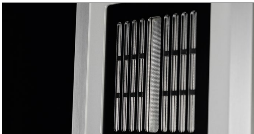
Die Bändchen sind in drei Zonen bzw. Bereiche aufgeteilt. Das mittlere Bändchen ist der Hochtöner von 3 bis 50kHz, links und rechts davon die Mitteltöner von 500 bis 3000 Hz

sierte frühlingshaft und Erleichterung verdrängte den Zweifel. Für einen kurzen Moment, wenn wir unsere Augen schlossen, waren wir wieder in Asien. Verführt in fremde Welten, fernab des Alltags. Welcher Verstärker wirklich perfekt mit den MLS2 harmoniert, erfahren Sie ab Seite 90 in dieser Ausgabe. Für den Augenblick wollen wir die Spannung aber noch ein wenig aufrecht erhalten und einfach genießen. Davon lebt ja schließlich so eine Liebe auch irgendwie. Einen wichtigen Rat geben wir Ihnen dennoch mit auf Ihre ganz persönliche Klangreise: Eine Kette klingt immer nur so gut, wie ihr schwächstes Glied. Und wie in jeder guten Beziehung sollten alle beteiligten Partner immer auf Augenhöhe miteinander umgehen. Wenn Sie das nicht beachten, könnten Sie vielleicht die Liebe ihres Lebens verpassen. ■