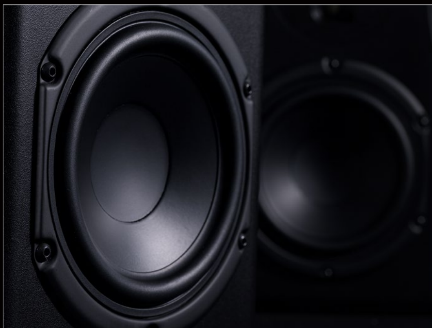
Von außen nicht zu erkennen, aber in den Ministra schlummern gleich zwei Tiefmitteltöner. Einer von ihnen ist im Inneren des Gehäuses – isobarisches Prinzip nennt man das

Klang, freuen Sie sich auf echte Liedermacher! Beispiel 2: Bob Marleys Klassiker „Jammin“ vom Album „Exodus (Remastered)“. Bei diesem Alltime-Favorite erkennt man ein weiteres Mal die Stärken der Ministra. Klare Kante in den Höhen, tolle Hihats und Rythmusgitarren und ein satter, sonorer, druckvoller Bass, wie er für den Reggae wichtig ist. Ein weiteres Hörbeispiel müssen wir hier auch noch erwähnen, nicht weil es uns so überzeugt hat, son-