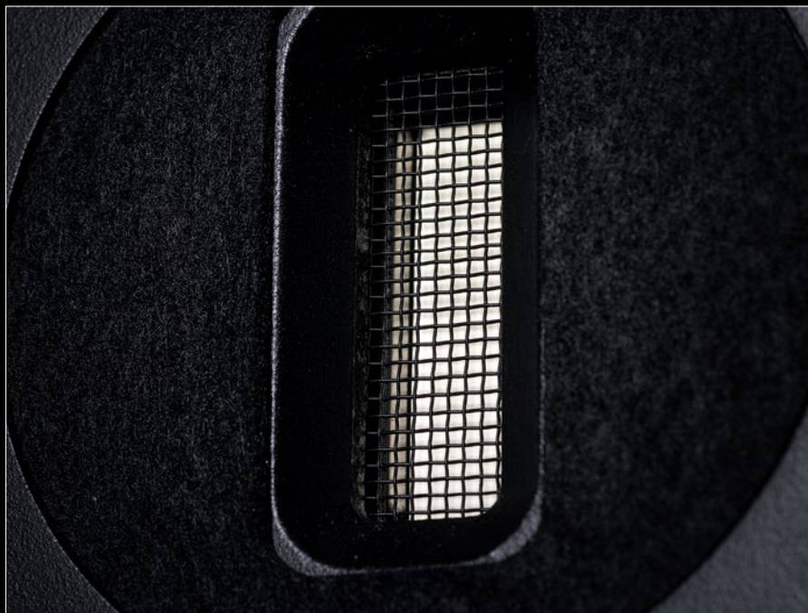
Das heimliche Highlight der Neat Acoustics Ministra sind die herausragend klingenden Bändchenhochtöner. Sie verleihen jeder Aufnahme Glanz und Tiefe

sind Musikinstrumente, denn sie verhalten sich genau so lebendig, wie die Kunst, die sie abbilden.