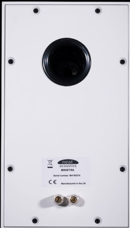
Die Anschlüsse sind funktional und auch der Bassreflex ist schlicht

dern weil es sehr genau die Grenzen des Lautsprechers definiert. Der Titel, den wir meinen, ist die ikonische und fast schon überproduzierte Hymne „Sky Full of Stars“ von Coldplay. Sie klingt musikalisch, kommt aber an die Stadionatmosphäre des Songs nicht heran, dazu fehlt es den Kompaktlautsprechern dann einfach an Hub und Lowend. Wer Stadionpop, House Music und ähnliche Subbassorgien feiern möchte, sollte einen Subwoofer beistellen, oder gleich auf einen Standlautsprecher von Neat umsatteln. Was die Ministra dafür perfekt beherrschen, sind akustische Instrumente, Stimmen, Schlagwerk und Percussion, kurz: Alles, wo es auf möglichst genaue Transienten ankommt. Daher möchten wir noch einmal kurz die Chance nutzen ihnen die Paradedisziplin der Lautsprecher noch einmal zu beschreiben. Kennen Sie Stings „If On A Winters Night“ aus dem Jahr 2009? Das Album vereint folkloristische und klassische Ansätze und konservierte viele weltbekannte Choräle und Weihnachtslieder in einer Art und Weise, wie sie eben typisch für Sting ist. Intim, wohlüberlegt arrangiert, feinfühlig und sensibel mit vielen Farben und Texturen. Die Ministra zaubern dabei Stings markant hauchig-kratzige